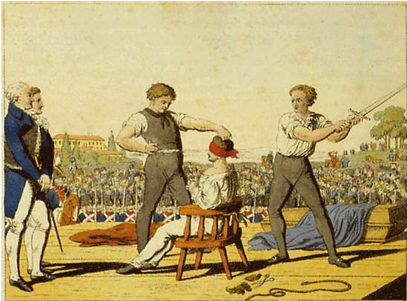
Sands Ende auf dem Schafföt